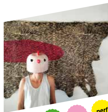
table ronde atelier proj perf

Billetterie en ligne : fierte.pm/monster